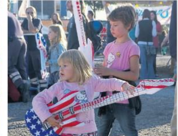
Fans halten hartnäckig ein Schild mit der Aufschrift „Die Banane“ hoch. „Dem Song spielen – wir beim nächsten Mal“, muss Gitarist Fossy das Publikum aus Zeitdrängen vertrieben.

„Als die Stimmung mit dem Auftritt der Ärzte-Coverband „Die Kassenpatienten“ ihren Höhepunkt erreichte,