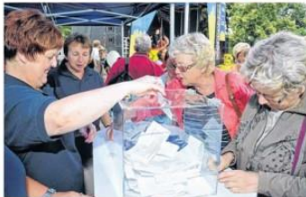
Dicht umlagert ist der Stand der LVZ, wo die Leser bei den Mitarbeiterinnen der Kreiszeitung ihre Coupons für das diesjährige Gewinnspiel abgeben können.