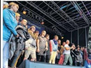
Am Ende der Modenschau versammeln sich noch einmal alle Mitwirkenden auf der Bühne.