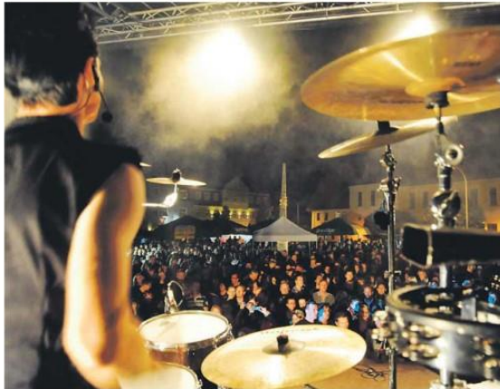
Bis Mitternacht spielt die Ärzte-Coverband „Die Kassenpatienten“ und füllt beim LVZ-Roßplatz-Open-Air am Freitagabend die Fläche vor der Bühne bis zum Schlussakkord mit ihren Fans.