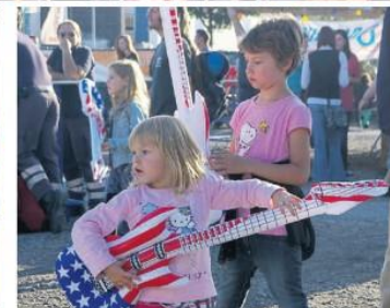
Stimmung mit der Band „Die Kassenpatienten“ und – früh übt sich – mögliche Nachwuchsmusiker.