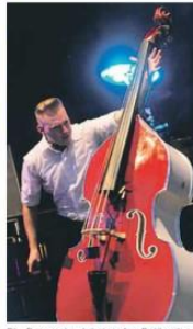
Die Barracudas bringen dem Delitzschern Rockabilly näher.

➤ Seite 19 Weitere Fotos: www.lvz-online.de/roetzsch