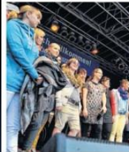
Am Ende der Modenschau versammeln sich noch einmal alle Mitwirkenden auf der Bühne.