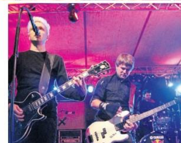
Richtig viel los bei Rock am Turm: Begeisterte Besucher (oben), Stimmung mit der Band „Die Kassenpatienten“ und – früh übt sich – mögliche Nachwuchsmusiker.